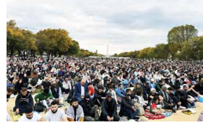
Beyaz Saray'ın karşısında Filistin için toplanan Müslümanlar.

Küçücük yavruları aç, susuz, evsiz bırakan, kendi yurdunda hapis, çileli dedeleri, nineleri bariyerlerle sınırlayıp bir saatliğine kardeşini görmek için diğer tarafa geçirmeyen, gencecik bir kızı, öbür taraftan diye, üniversiteye gitmekten alıkoyan, bir mabedin içinde bile insanları itip kakanların,