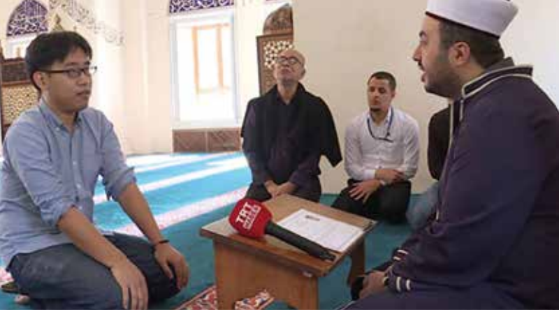
Yanda, Tokyo Camii'nde Müslüman olan Japon genç.

Noel, Cadılar Bayramı, Sevgililer Günü gibi kutlamaları olmayacak.”