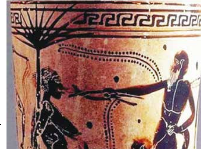
Resim 4: Antik Yunan'da şiddet temalı bir vazo resmi, Atina, Arkeoloji Müzesi, (M.Ö. 450-323)