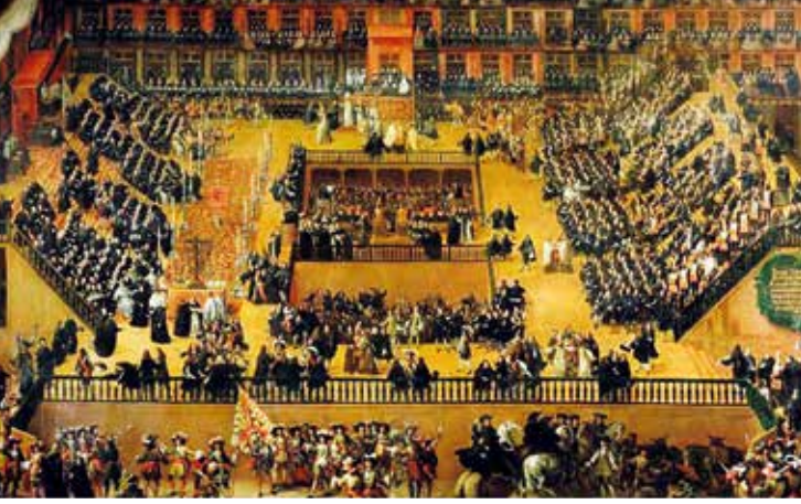
Resim 6: Francisco Rizi, Auto de Fe-Ateşte Yakma (1683), Prado Müzesi, Madrid