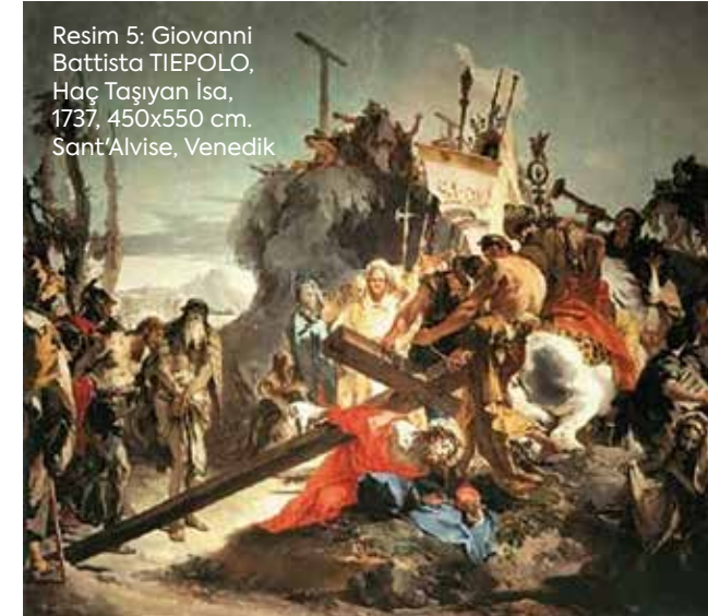
Resim 5: Giovanni Battista TIEPOLO, Haç Taşıyan İsa, 1737, 450x550 cm. Sant'Alvise, Venedik