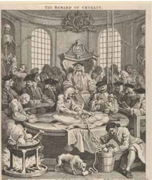
Resim 8: William Hogarth, Zalimliğin Bedeli, 1751. Gravür. 40.3x32.4 cm. Brooklyn Müzesi

İbrahim'i ateşe atması en önemli şiddet olaylarından birisidir. İnsanları ateşte yakarak cezalandırmak ve ateşin korkutucu gücünden yararlanmak çok eski bir şiddet ve gözdağı verme yöntemidir. (Resim 2)