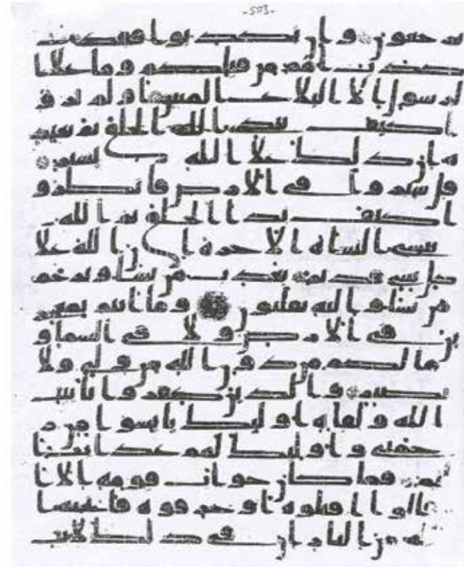
Topkapı Mushafı, Ankebût sûresi 29/18-24 (TDV İSAM Ktp. Demirbaş No: (079374)

Hz. Osman zamanında, özellikle farklı Arapça