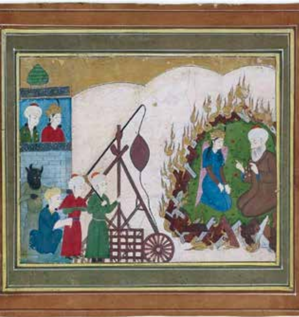
Resim 2: Hz. İbrahim'in ateşe atılmasını gösteren 17. yüzyıl minyatürü

Sanat estetik ve güzel olanı yansıtır. Sanatkâr iç dünyasında ve dış dünyada yaşadığı korku, ümit, aşk, feyz ve vecd hallerinden de beslenir. Sanatın, güzellik yanı sıra trajik ve dramatik konuları da ele alması kaçınılmazdır. Sanatçı yaşadığı zamana ve mekâna tanıklık eder. Güzel insanların ve manzaraların yanı sıra, çirkin olan ya da acı veren temalar da sanat eserlerinde yansıtılır.