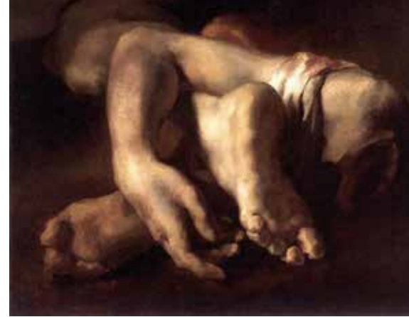
Resim 9: Gericault, Kesilmiş Kol ve Ayaklar, 1818, 52.64 cm. Musée Fabre, Montpellier, Fransa

Toplumun gözü önünde işkence ile vücudu parçalanan mahkûm daha sonra halka açık bir gösteri olarak cesedi teşhirciye tabi tutulur. Bütün bunlar perşembe günü başlar ve cumartesi günü birincisini yineleyen ikinci bir vaaz ile sona erer. (Resim 9)