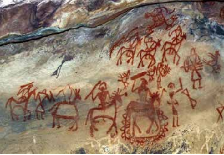
Resim 1: Savaş sahnesi (detay), kaya sığınağındaki resimler, Üst Paleolitik dönem, Bhimbetka, Hindistan