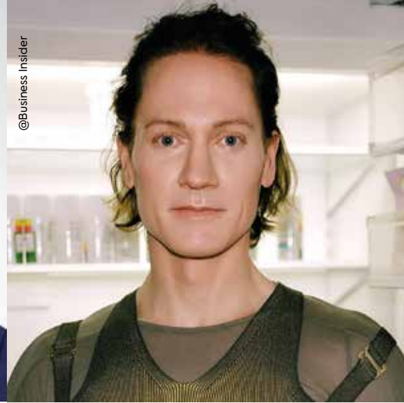
Bryan Johnson, şimdi.

Tüm bu araştırmalar genelde tek bir etken üzerine yoğunlaşır ve bilimin kurallarına göre açık bir şekilde yapılır. Adımlar ve kullanılanlar bellidir ve rahatlıkla kritik edilebilir ya da hakem kurulu tarafından reddedilir. Bryan Johnson'un bu şekilde kendi bedenini bir laboratuvar faresine dönüştürmesi ise bilimin doğrulayabileceği veya herkese tavsiye edilen bir program olamaz. 111 tane hapi aynı anda aldığınızda, bu kimya-