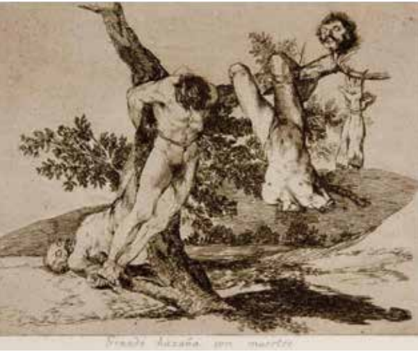
Resim 7: Francisco Goya, Savaşın Felaketleri serisinden (Harika kahramanlık! Ölü insanlara karşı!) (1810-1820) Prado Müzesi, Madrid, İspanya