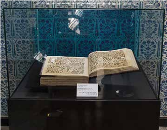
Topkapı Sarayı Müzesinde Sergilenen Kur'an nüshası

Yemâme Savaşında çok sayıda kurra (hâfız) sahabenin şehit düşmesi, Hz. Ömer'i Kur'an'ın kısmen de olsa kaybolması endişesine sevk etti. Bu endişeyle İslam'ın ilk halifesi Hz. Ebubekir'i Kur'an'ı cem etmeye (toplamaya) zorladı. Başlangıçta, Hz. Peygamber (asv) hayattayken böyle bir işe girişmemesi sebebiyle Hz. Ebubekir, "Peygamberin yapmadığı