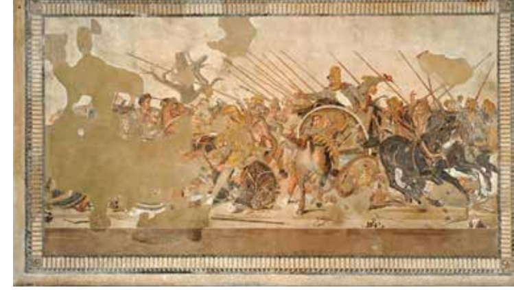
Resim 3: Pompei'de bulunan Büyük İskender Mozaïği, M.Ö. 333 zaferi

Kutsal kitaplarda çok sayıda kıssa göç ve savaş içerisinde şiddet, işkence olaylarını anlatır. Bu kıssalar içerisinde Nemrut'un