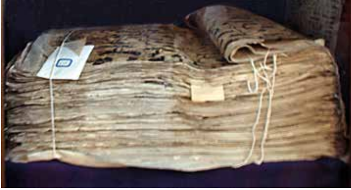
Semerkant Kur'an'ı (Özbekistan-Taşkent)